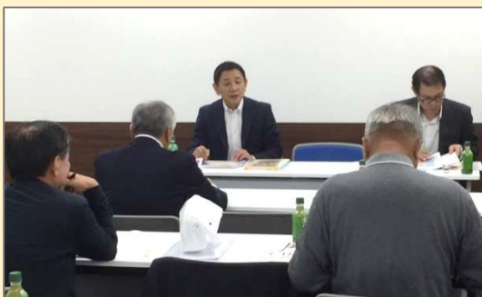
平成30年相続支援セミナー開催予定日

江坂塾にご入会いただくと江坂塾主催の様々なセミナーに無期限で無料でご参加いただけます。また会員特典として毎月お得な情報誌をお届けさせていただきます。ご検討くださいますようお願いいたします。(※初回のみ入会金3000円が必要です)